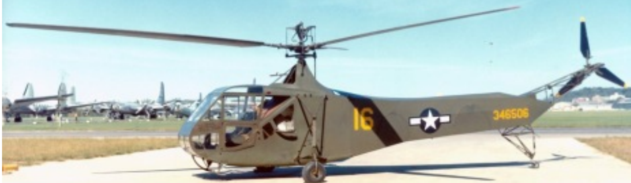
Cliquez sur le lien ci dessous pour une autre page sur le R4 http://en.wikipedia.org/wiki/Sikorsky_R-4

http://www.sikorskyarchives.com/S-47.php