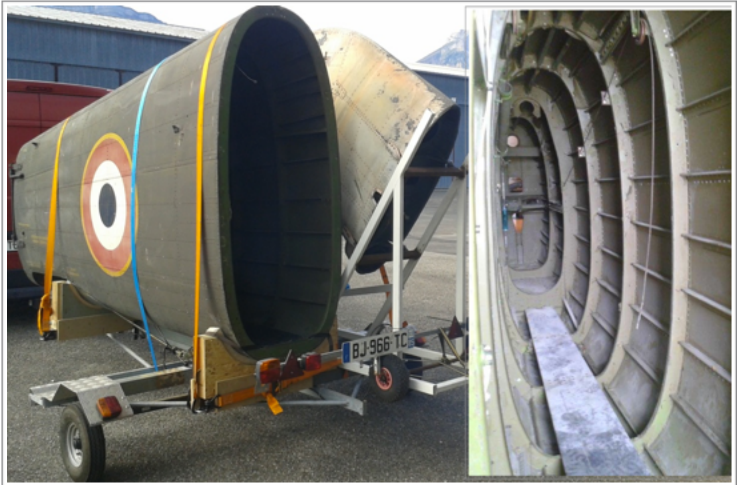
Photo ci dessous, les deux plus grosses pièces: une poutre de queue et un pylône de queue en parfait état de conservation, préservés au CELAG pendant de nombreuses années, sont parties en remorque pour servir à la restauration future de la cellule du H34-SA 55 d'un Siko en vol en Vendée.